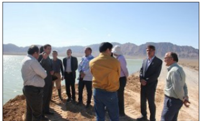
نشستی بند رحیم آباد ابرکوه ترمیم شد