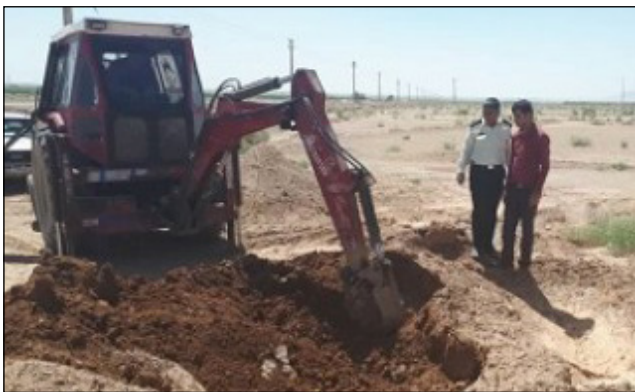
چهار دستگاه تراکتور متخلف در شهرستان خاتم توقیف شد