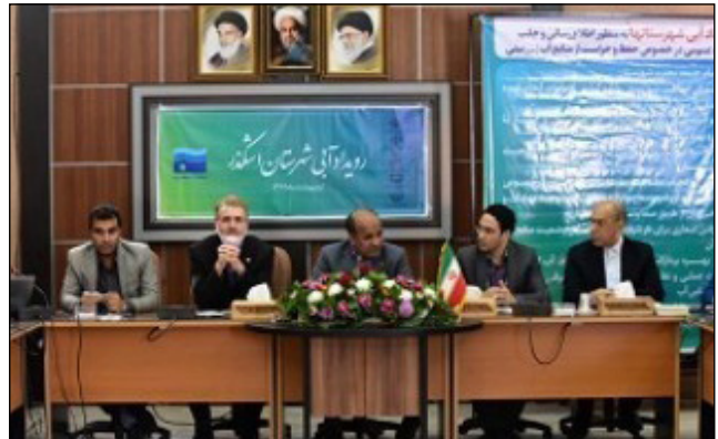
بهره برداری از خط سبز تامین آب صنعت در یزد